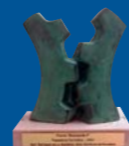
Premio "Economía 3" - 2007 Mejor Trayectoria Formativa